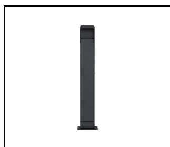
Bein für Ladegerät LENERGIZEE Graphit. schwarz RAL7016/9005 mat (424021)