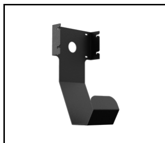
LENERGIZEE Kabelaufhänger RAL9005 (424281)