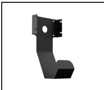
LENERGIZEE Kabelaufhänger RAL9005 (424281)