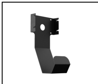
LENERGIZEE Kabelaufhänger RAL9005 (424281)