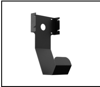
LENERGIZEE Kabelaufhänger RAL9005 (424281)