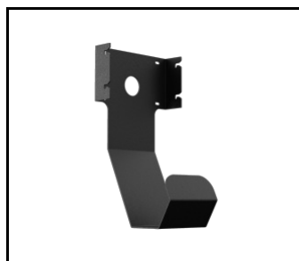
LENERGIZEE Kabelaufhänger RAL9005 (424281)